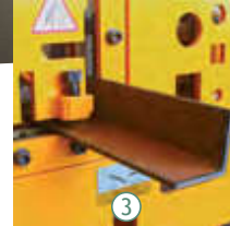
3 Köşebent kesme istasyonu Angle cutting station Rezka ugolka