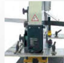
3 Açılı köşebent kesme Angle section (45°) cutting Rezka ugolka pod uglom

HKM 40 может пробивать диаметр до 38мм (* Диаметр пробивки, толщина материала могут быть изменены в зависимости от модели (смотри таблицу)