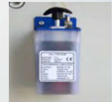
5 Merkezi yağlama pompası Central Lubrication Pump Насос для смазки