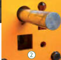
2 Yuvarlak mil kesme istasyonu Round solid bar cutting station Rezka круглого прутка