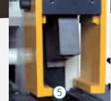
5 U çentik açma istasyonu U-notching station Высечка