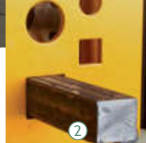
2 Kare dolu profil kesme istasyonu Square solid bar cutting station Rezka квадратного прутка