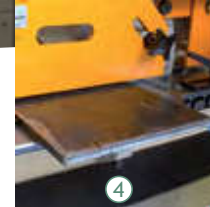
4 Lama kesme istasyonu Flat Bar cutting Station Rezka lista