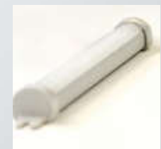
5 Led aydınlatma Led lighting светодиодная подсветка

Электронный задний упор для настройки размера резки (стандартно для 2-х поршневых)